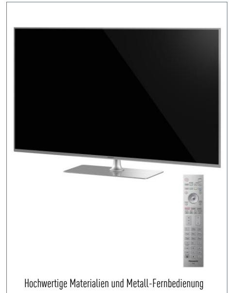
Hochwertige Materialien und Metall-Fernbedienung

Neue Möglichkeiten des Fernsehens – Unterstützung von TV>IP , zahlreicher Apps und des HbbTV Operator App Standards